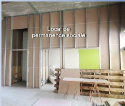
Local de permanence sociale

2020, une nouvelle naissance s'annonce ! Au-delà d'une conception douloureuse, l'allégresse prédomine. Les soutiens se multiplient ! Parrains et marraines s'activent autour du landau du 23 rue Sergijsels à Koekelberg. Les experts « en accouchement administratif » se mobilisent pour assurer un déroulement harmonieux et les sages-femmes des différents corps de métier s'activent pour bien accueillir le bébé et pour répondre à tous ses futurs besoins. Malgré leur fatigue légitime, ses parents exultent !